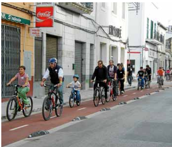
Grans i petits gaudiren amb tranquil·litat del nou carril bicicleta.